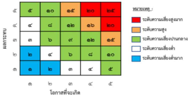
แผนภูมิความเสี่ยง (Risk Profile)

ระดับความรุนแรง = โอกาสที่จะเกิดเหตุการณ์ x ผลกระทบที่เกิดความเสียหาย